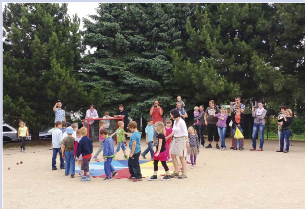
Červnové rozloučení se školkou