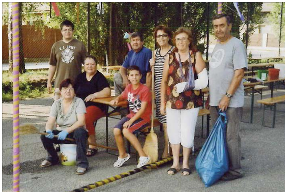
Tradiční pomoc seniorů při organizaci Vavříneckých hodů