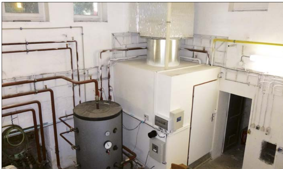
Stav po rekonstrukci

školký. Potrubí vykazovalo na několika místech trhliny, kudy unikala voda do podzemí.