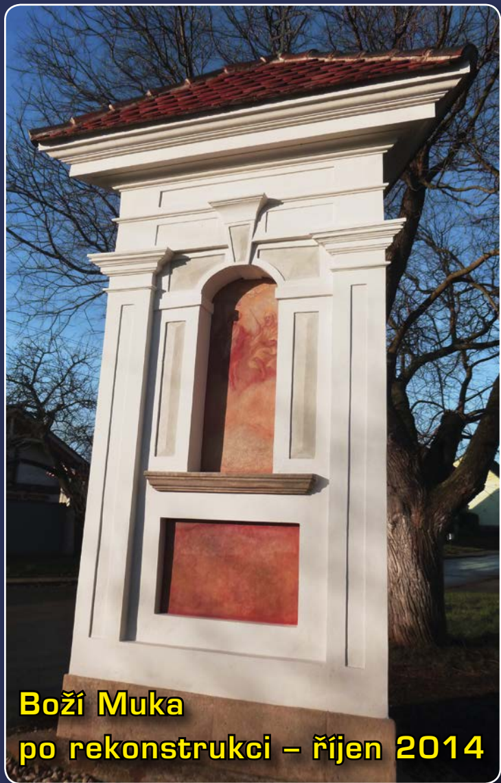
Boží Muka po rekonstrukci – říjen 2014