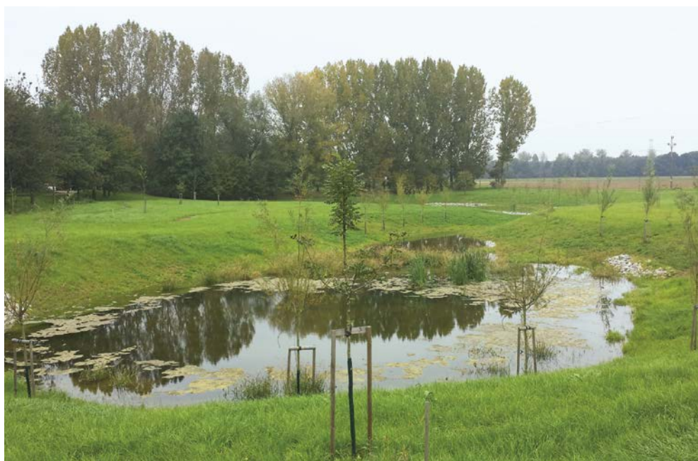
Vojkovičká vrbovna – jižní mokřad