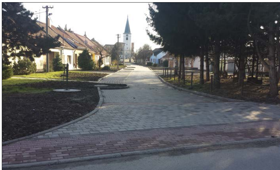
Stav po rekonstrukci