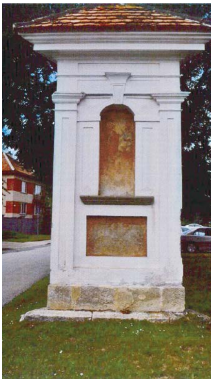
Boží Muka před rekonstrukcí v roce 2014