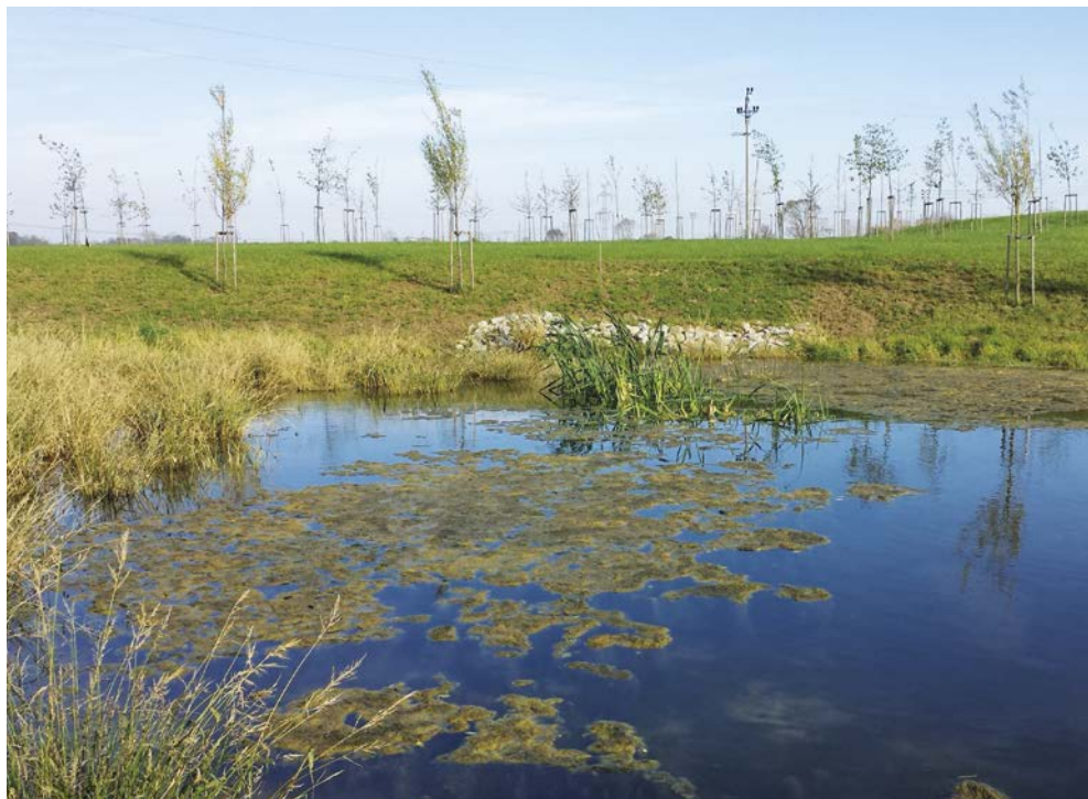
Vojkovičká vrbovna – jižní mokřad