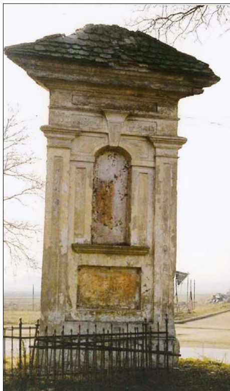
Boží Muka před rekonstrukcí v roce 1996