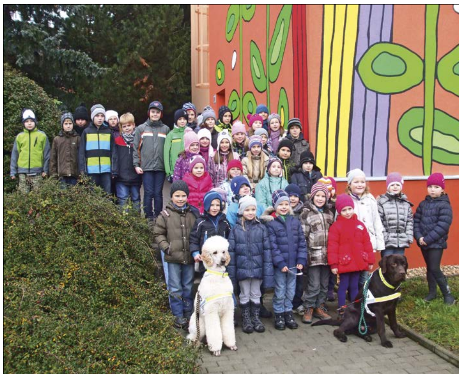
Děti s vodícími psy pro nevidomé ze školy manželů Dvořákových

V rámci volnočasových aktivit zajišťujeme kroužek zábavné matematiky, keramiky a sportovní kroužek. Pronajímáme též prostory agenturám, díky nimž můžeme nabídku rozšířit o taneční kroužek, vědecké pokusy a angličtinu.