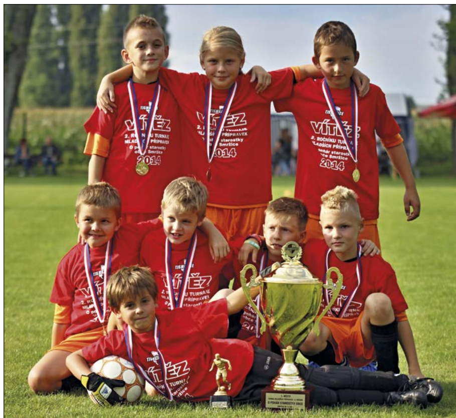
Vítězové turnaje mladších přípravek o pohár starostky obce Smržice

statek hráčů pro častější střídání je příčinou jejich umístění ve spodní části tabulky. Nicméně není proč všeset hlavu. Hráči jsou to šikovní a pokud na sobě budou ve spolupráci s kvalitním trenérem pracovat a pokud se podaří rozšířit jejich řady, mají své sportovní úspěchy jistě před sebou.