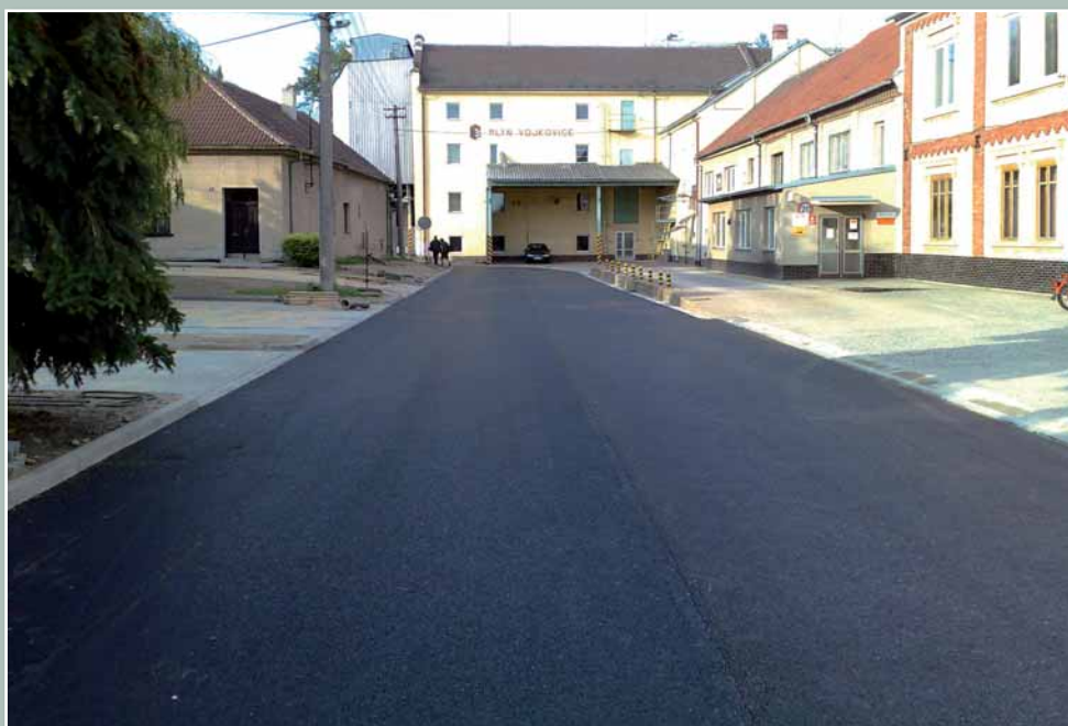
Místní komunikace v ulici Mlýnské po rekonstrukci