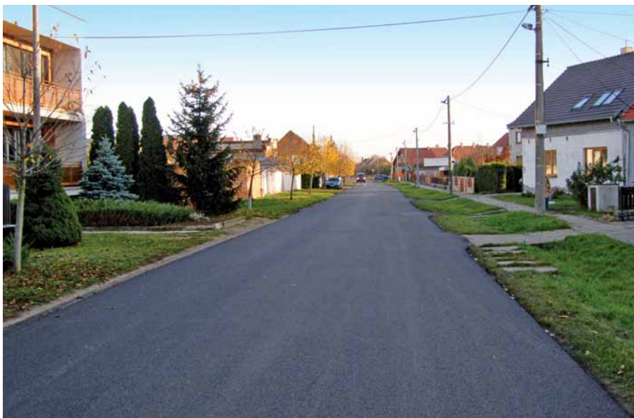
Stav komunikace po opravě – ulice Blatná