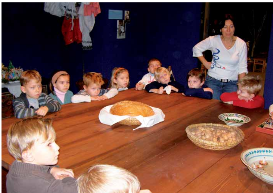
Za dlouhých zimních večerů, Moravské zemské muzeum