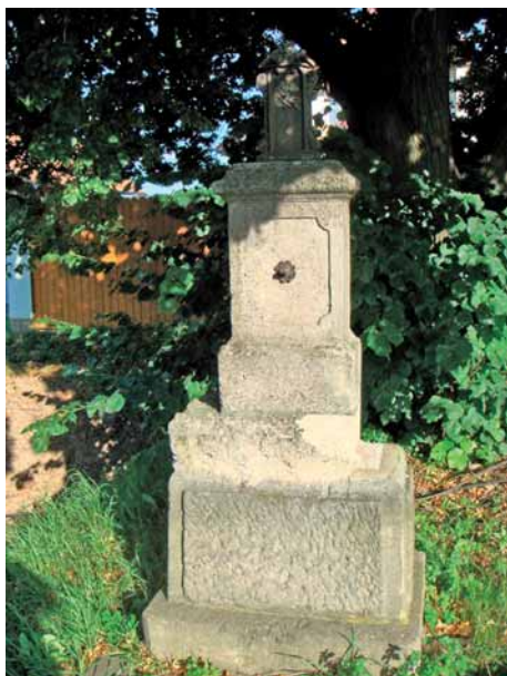
Kříž pod lípou před rekonstrukcí