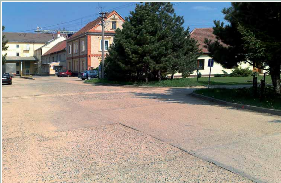
Místní komunikace v ulici Mlýnské před rekonstrukcí