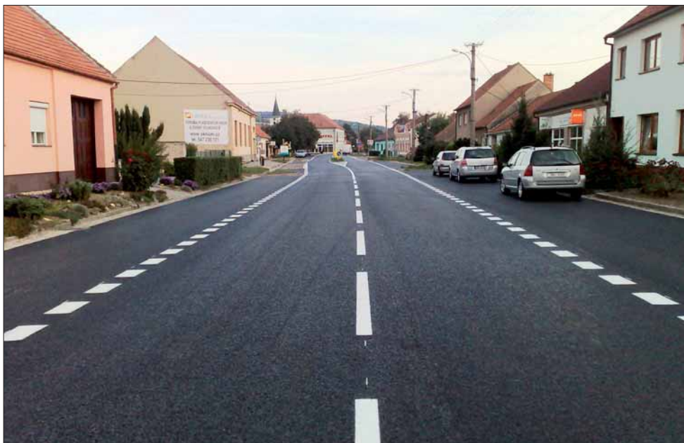
Silnice v ulici Hlavní po rekonstrukci