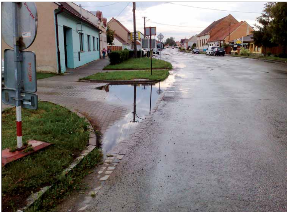
Silnice v ulici Hlavní před rekonstrukcí