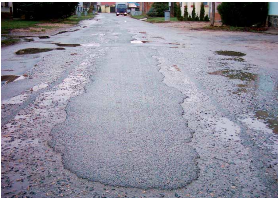
Stav komunikace před objíždkou – ulice Blatná