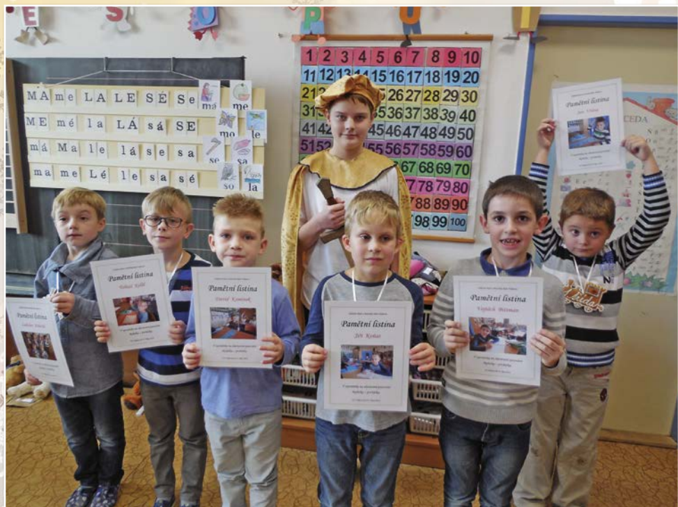
Slavnostní pasování na prvňáčky