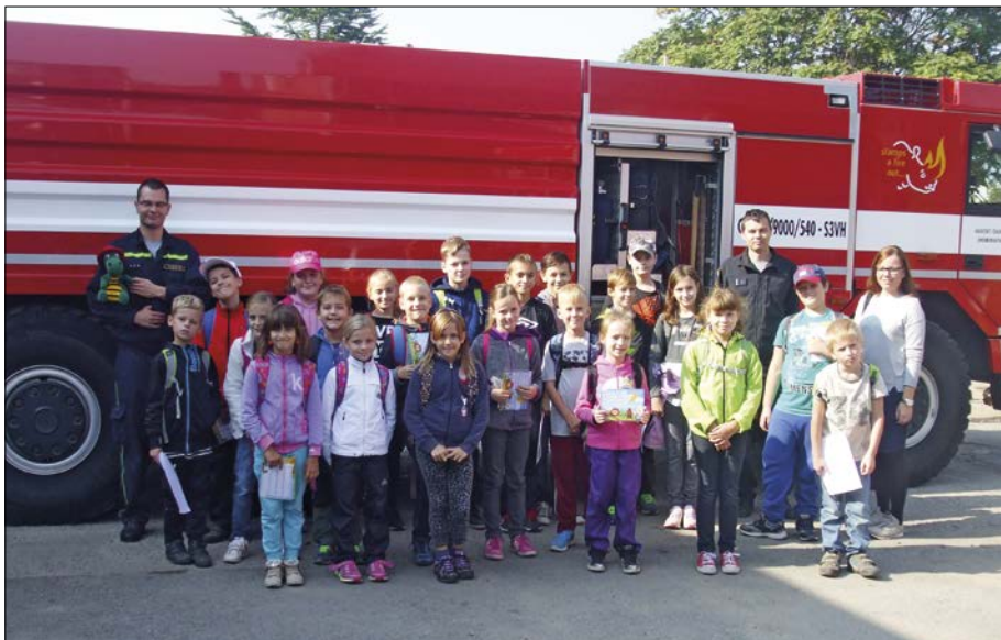
Na návštěvě u hasičů v Židlochovicích

Standardní vzdělávací činnost rozšiřujeme o další aktivity, jako jsou exkurze, výchovné pořady, návštěvy výstav a divadelních představení či projektové dny. Děti již navštívily požární hasičskou zbrojnicí v Židlochovicích, s profesionálními záchranáři se učily základům zdravotní péče, absolvovaly výukový program Zdravá pětka. Starší žáci se zúčastnili výukového programu v jaderné elektrárně Dukovany a ve vodní elektrárně Dalešice; mladší žáci shlédli vzdělávací pořad v planetáriu v Brně. Velmi zajímavá byla též výstava Dobrodružství abecedy a prohlídka kláštera v Rajhradě. Žáci prvního ročníku též uspořádali malou slavnost pro svoje nejbližší – pasování prvňáků, kde měli možnost ukázat, co všechno už se od září naučili.