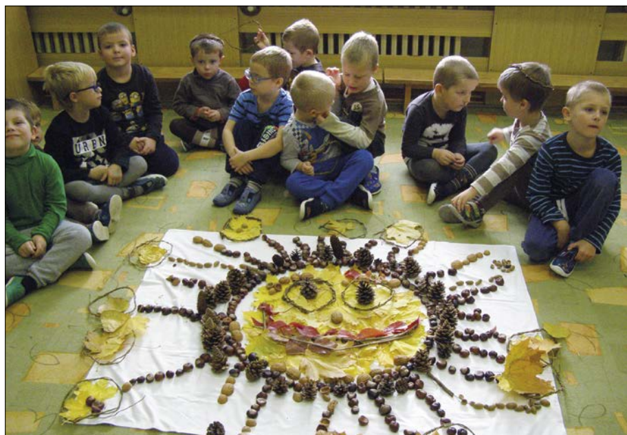
Hra s listy