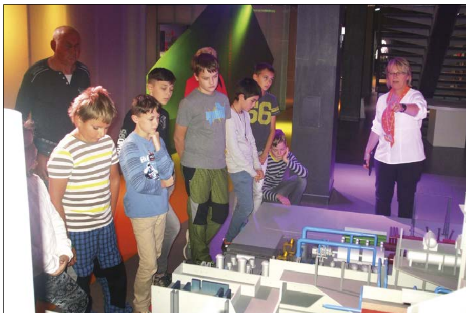
V jaderné elektrárně Dukovany

V prosinci se naše škola prezentovala kulturním vystoupením při rozsvěcení vánočního stromu. Ve spolupráci s ochotnými maminkami proběhly ve škole vánoční dílny s výrobou drobných dekorací a dárečků.