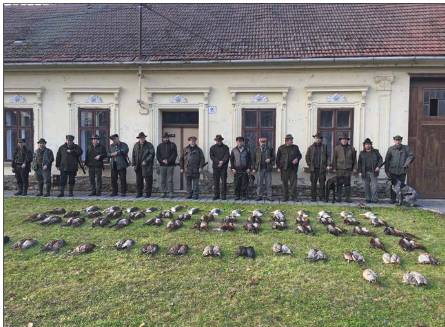
Výřad po honu

V pronajaté myslivně jsme opravili hlavní místnost a ve spolupráci s obcí se podařilo také vyměnit okna na budově. Samozřejmě nemohu zapomenout na opravy krmných zařízení v naší honitbě (zásypy, krmelce, atd.), ve kterých již v současné době intenzivně přikrmujeme.