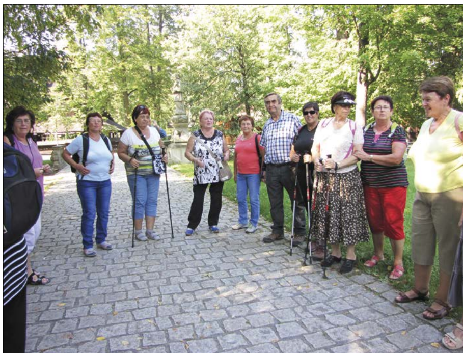
Zájezd seniorů do skanzenu v Rožnově pod Radhoštěm

mnohem více, co pro naši obec děláme, a hlavně to děláme rádi. Většina našich seniorů je také členy Svazu zdravotně postižených. I tato organizace, stejně jako ta naše, pořádá pro své členy různé kulturní akce. Proto ročně naši senioři absolvují desítky zájezdů: divadelní představení, návštěvy zámků, květinové výstavy, relaxační zájedy do termálů, bylinkové přednášky, koncerty, plesy atd.