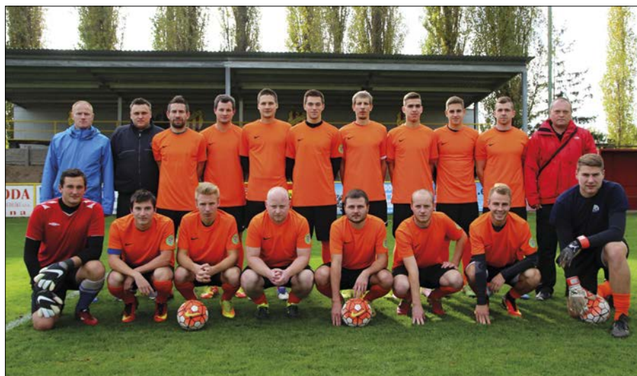
A tým muži

přípravky to bylo chvíli o zvyku, ale brzy jsme se srovnali a zvykli si nejen na jejich odchod, ale i na tváře nově příchozích kluků. Letošní podzimní sezónu jsme zakončili velmi úspěšně hlavně díky tomu, že kluci chodili rádi a s nadšením a díky tomu nadšení dokonce někteří přibyli. Z toho máme největší radost. Výsledkem je 2. místo v naší soutěži, a to za 11 výher, 1 remízu a 2 prohry, dodává závěrem trenér.