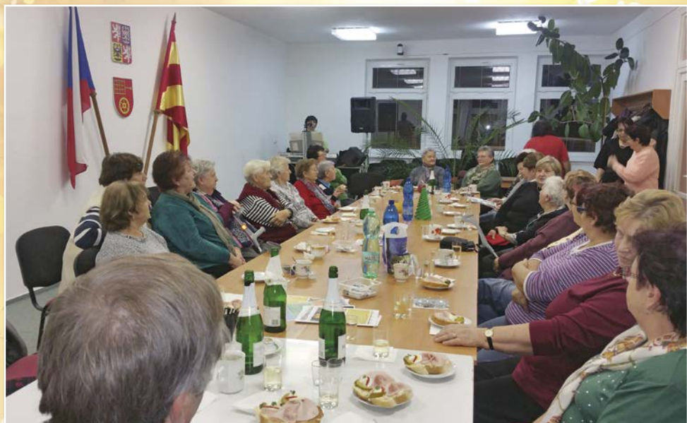
Předvánoční posezení seniorů s hudbou