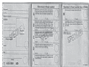
ŘP vydány v období: 1.7.1964-1986