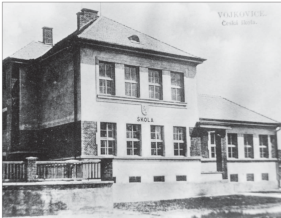
Základní škola dříve

Přesto jsme se již delší dobu snažili pořídit si vlastní keramikou pec, kterou by využívali nejen žáci základní školy, ale i děti z mateřské školy. V budoucnu bychom chtěli nabídnout i „keramická odpoledne“ pro naše bývalé žáky nebo rodiče s dětmi.