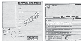
ŘP vydány v období: 1992-1993