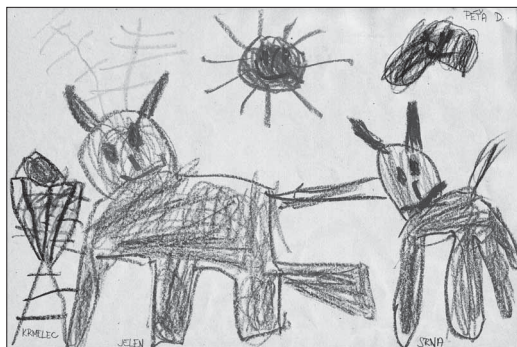
Výtvarné umění dětí.