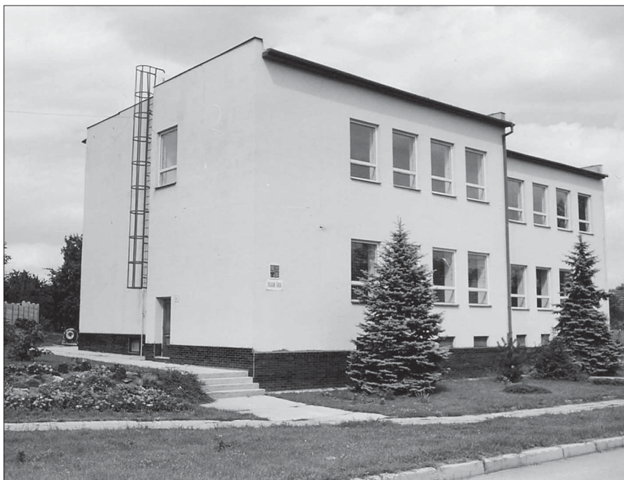
Základní škola dnes