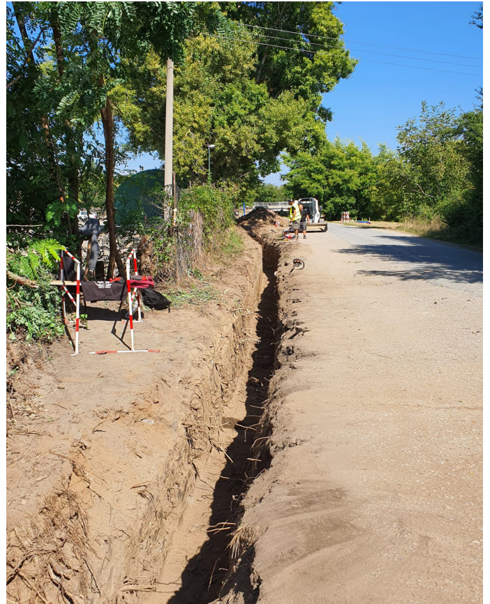
vlevo: Blučina – odlehčovací komora na kanalizaci OK1, Ulice 9.května vpravo: Obnova vodovodu Vojkovice ulice Brněnská