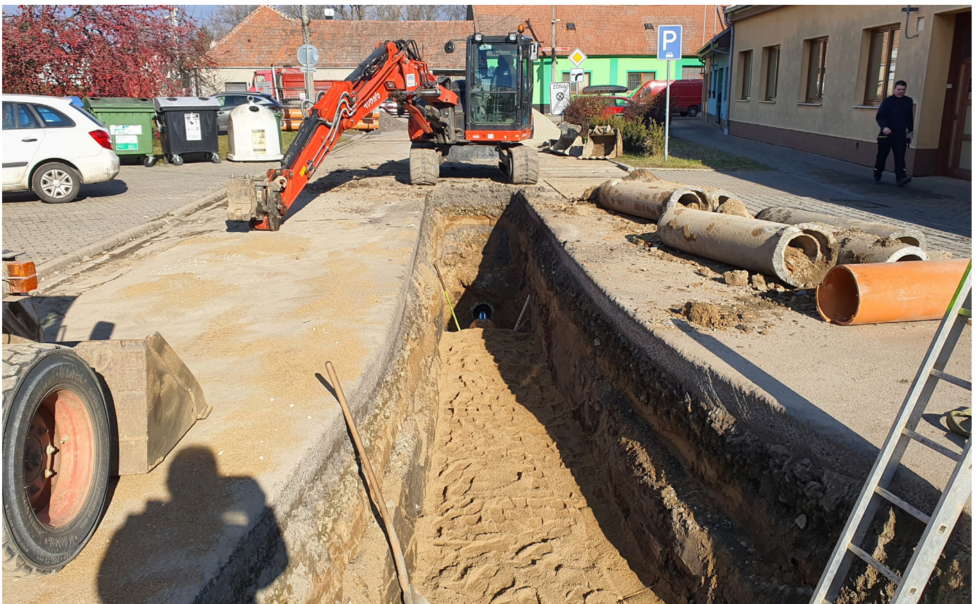
Hrušovany – Masarykova, oprava kanalizace a rekonstrukce vodovodu