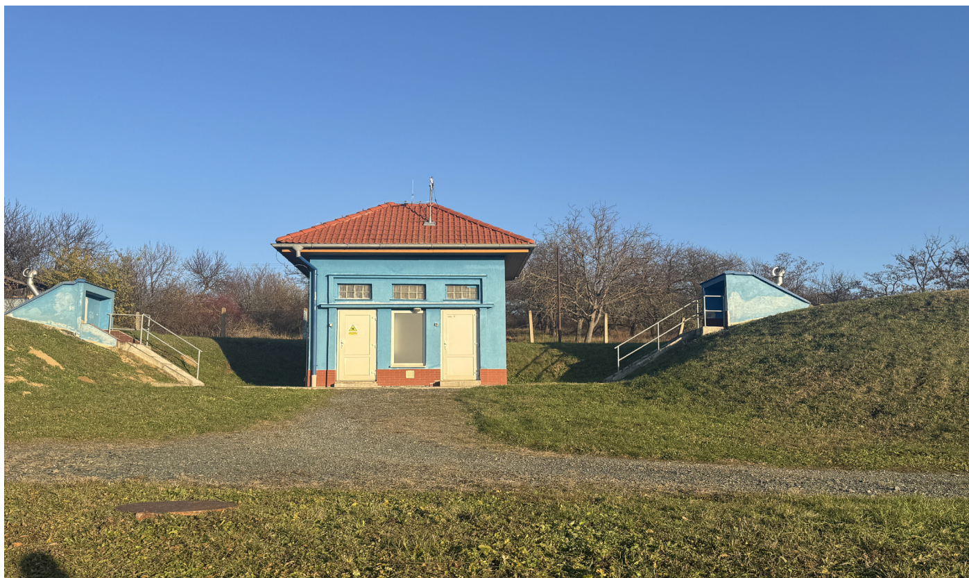
Současný stav . Uprostřed provozní budova. Nalevo vodojem 400 m 3 , napravo vodojem 650 m 3