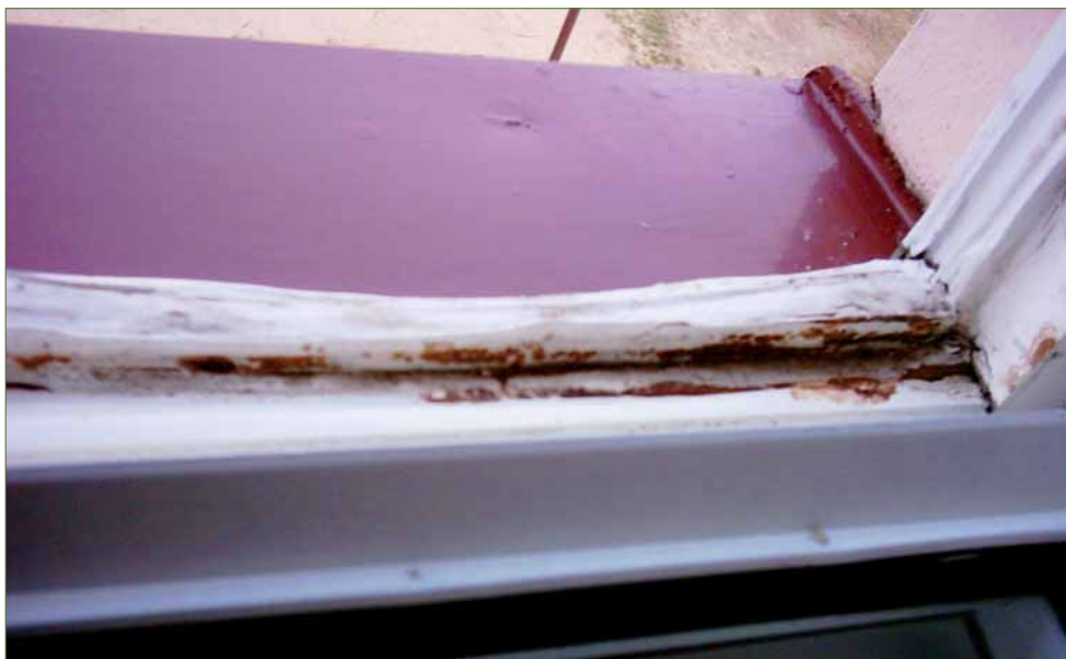
Takto vypadají okna v ZŠ.