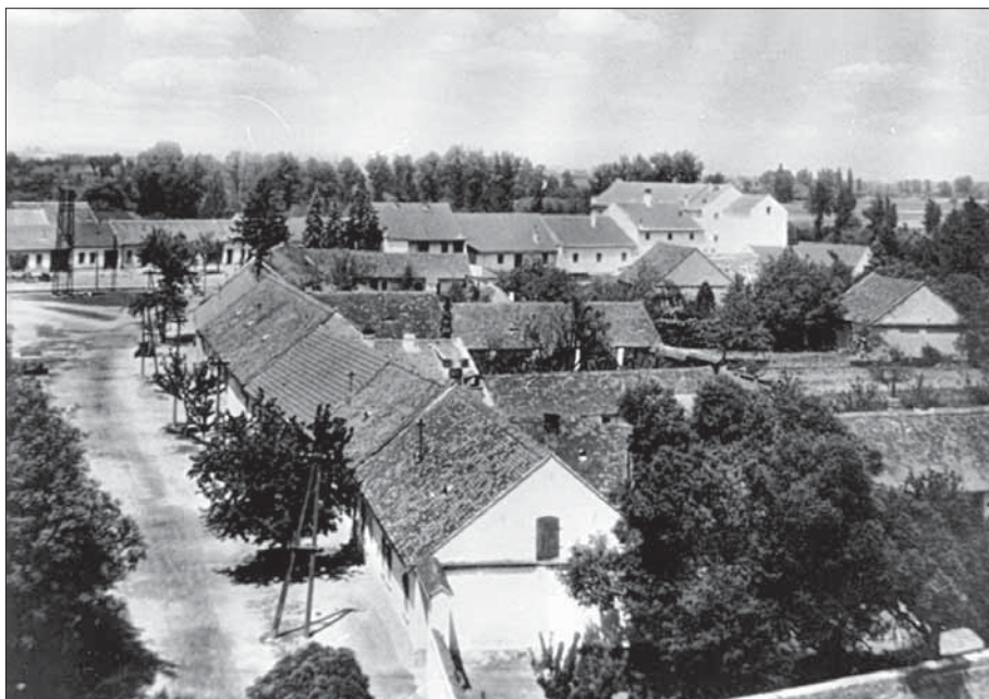
Takový býval pohled na ulici Mlýnskou z věže kostela. Napravo ovocné stromy, nalevo ořechová alej.

tkáni, kde byly za účasti zastupitelů, projektanta komunikace a zahradní architektky znovu prodiskutovány veškeré požadavky na novou úpravu. Na ně navázalo 22. července 2008 druhé veřejné setkání, kde byla představena zpracovaná studie a sesbírány poslední připomínky, které byly následně do studie zapracovány.