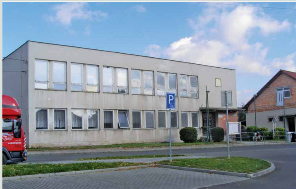
Budova OÚ před zahájením rekonstrukce v roce 2007