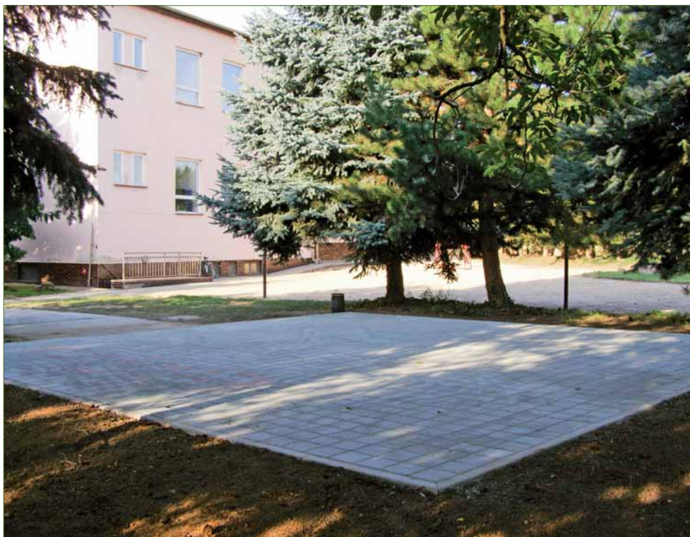
Nově vybudovaná terasa na výjuku v přírodě