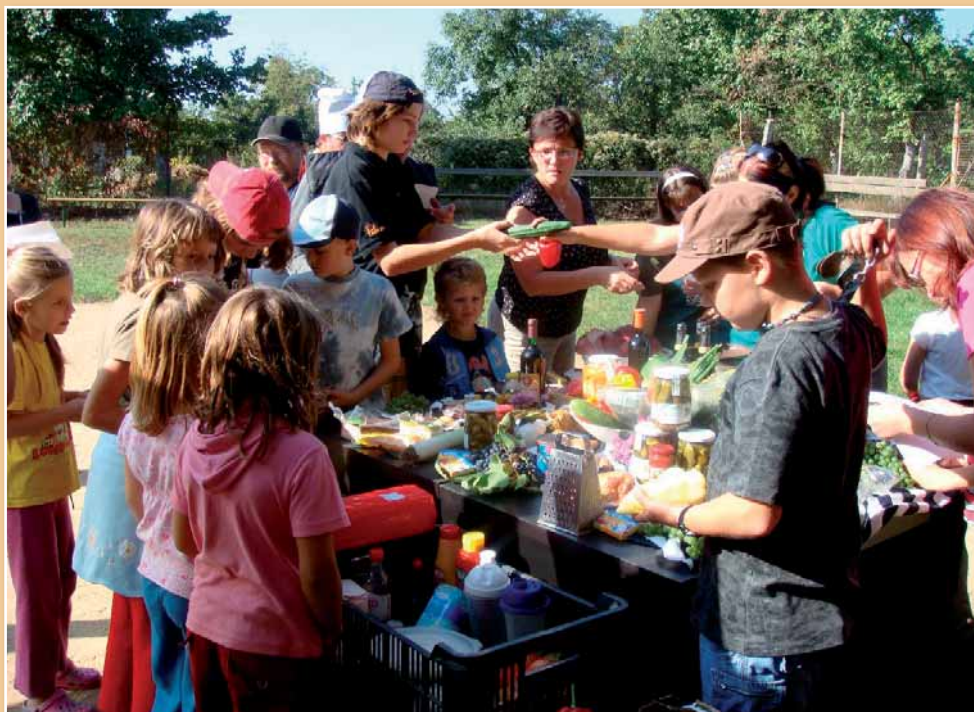
Gulášový festival v ZŠ 26. 9. 2009