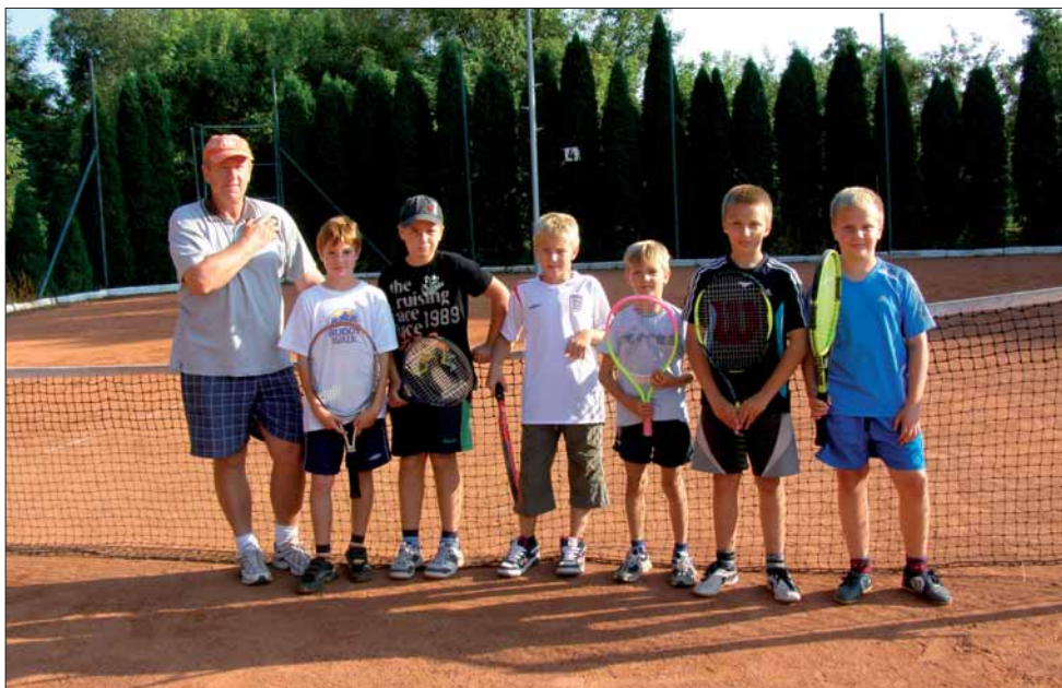
Mládežnická základna tenisového klubu