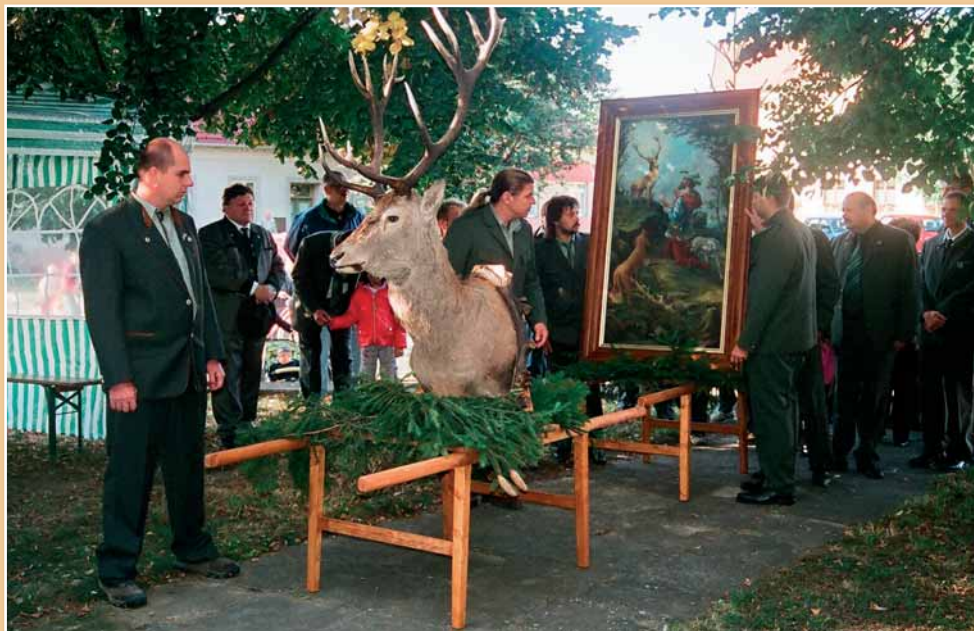
Svatohubertská mše svatá