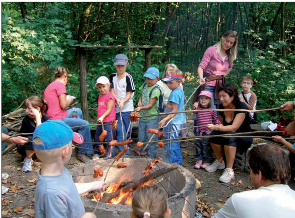
Výšlap dětí z MŠ na Výhon