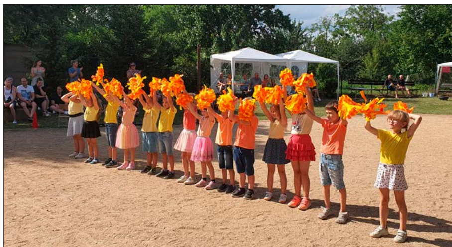
Rozloučení s pátáky

Koncem června jsme po dvouleté nucené pauze uspořádali tradiční rozloučení s pátáky, letos ovšem v netradičním pojetí jako zahradní slavnost. I přes horké počasí podali žáci při svých vystoupeních vynikající výkony a věřím, že všichni návštěvníci prožili příjemné odpoledne.