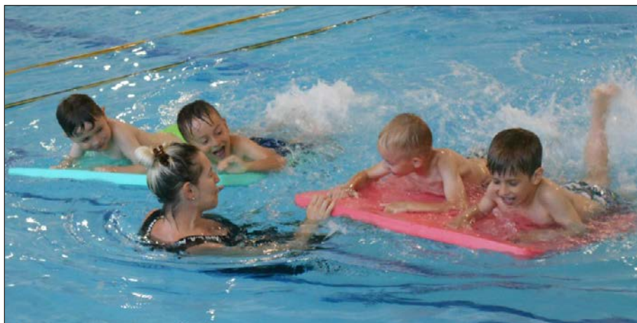
Plavání v Hustopečích