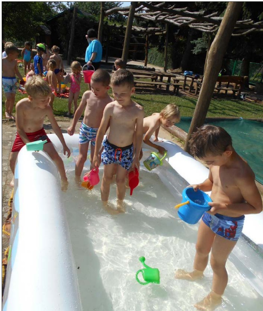
Modrý den, hry s vodou