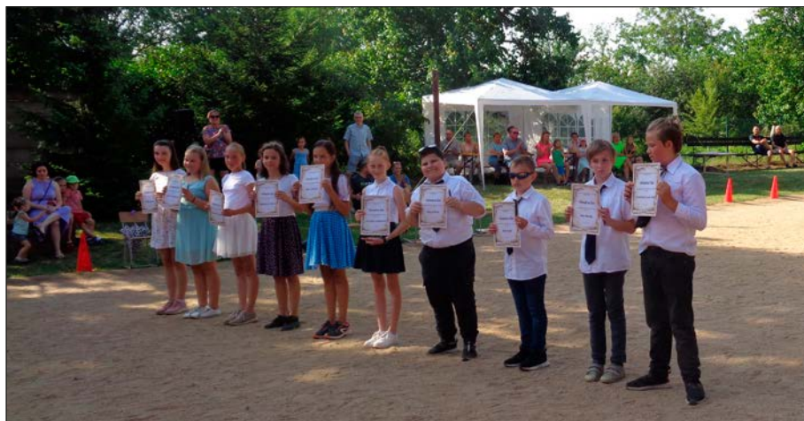
Rozloučení s pátáky