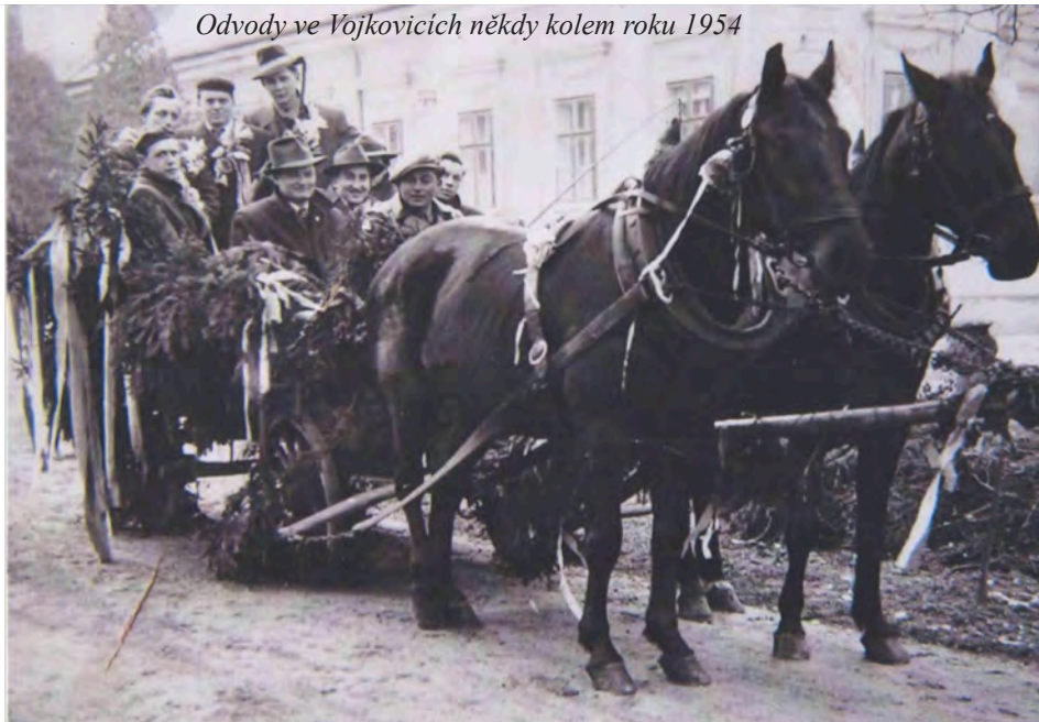
Odvody ve Vojkovicích někdy kolem roku 1954