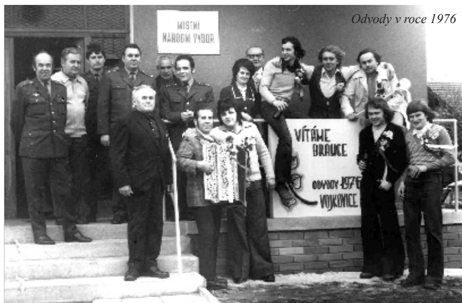
Odvody v roce 1976

Branci společně s odvodovou komisí v roce 1976 před budovou Místního národního výboru (dnešního obecního úřadu).