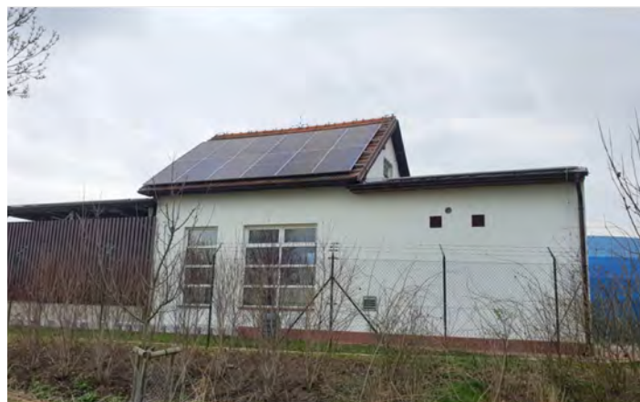
Budova kalové koncovky